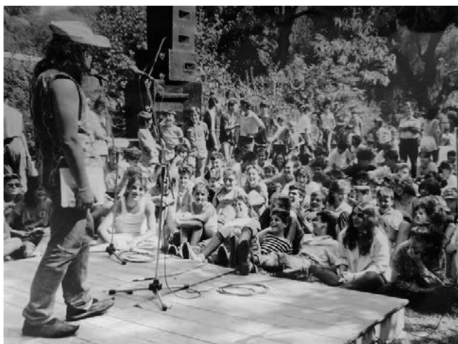
Бора Ђорђевић на Стрaжилову, 1987.