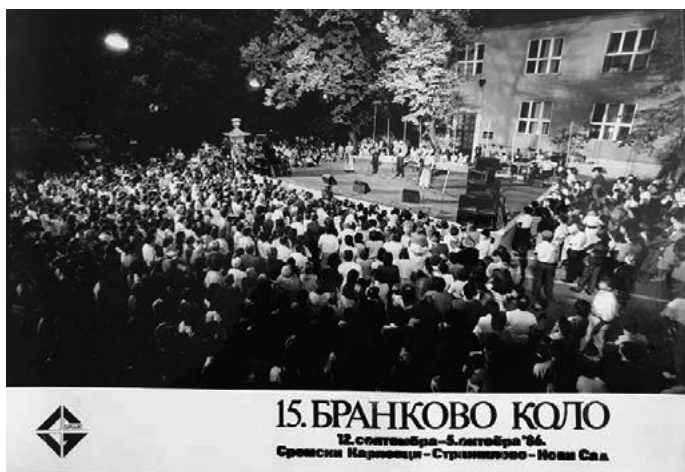
Ансамбл Ођила у Сремским Карловцима, 1986.

Здрaво и збојом јесу зглобни замајци Бранкове лирске поезије. Раскршћа где се учетворују спознаје. Ту се сустичу и преливају дан и ноћ, живот и смрт. Има ли шта прече у поезији? Приговори да су то прежвакане „вечите теме” не стоје, нема им места у доживљају света какав је Бранков. У великој поезији тако мора бити, песник се грли са вечним питањима света. Улог је велик, али другачије не може, све друго симпатичне су игрице и цаке, штосеви и трикови, који могу бити занимљива решења на плану језика као материјала, али даље – не допире, нема надљубавне супстанце речи.