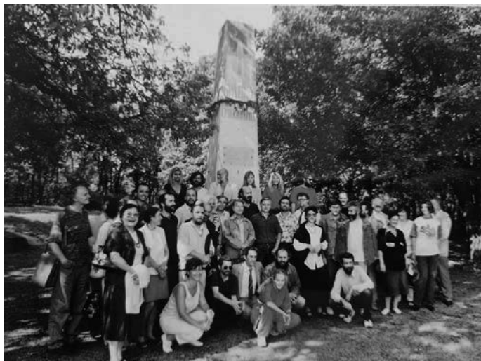
Песници и уметници на Сйражилову йоред Бранка, 1994.

Песник неокласициста, Јован Стерија Поповић, не прихвата њему туђ и нејасан свет романтичарске поезије: „Поезија детињасте несташности, непокривене похотљивости, неразборите самопоузданости, бестидне грубости, крајњега незнанства о људима и стварима.” Овом препотентном удару на Бранкову поезију, као и сличним нападима Светозара Милетића, одговара Јован Ђорђевић, иначе добар Милетићев пријашин: „Ви нисте разумели племениту резигнацију певца, који упркос свим хулама и мракозборцима, свим мржњама и гоњењима, изложен за истину слободу и правду, у крваву борбу ступио.”