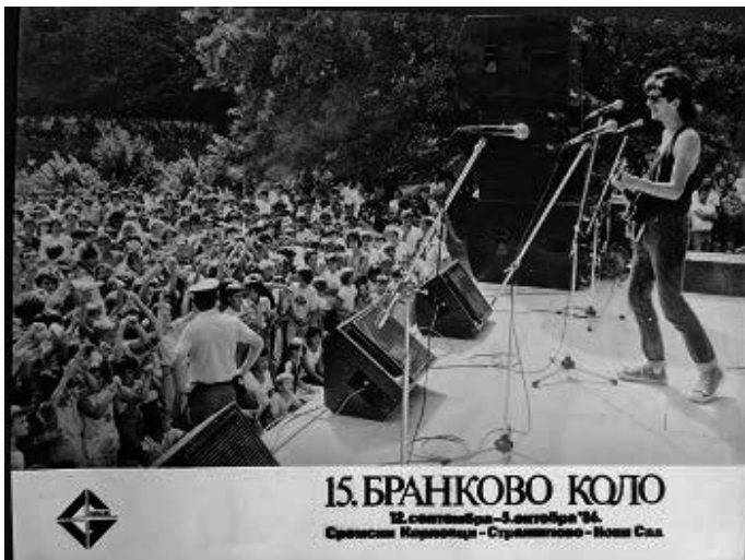
Бајага на Стражилову, 1986.