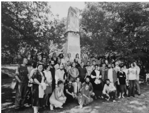
На 23. Бранковом колу, Сїражилово 1994.

– Поводом великої јубилеја: 200. ѡдишњице Бранкової рођења, а с обзиром да је Радичевић ѡхоћао Карловачку їмназију (1835-1841), Бранково коло дарује ѡцима и ѡрофесорима ове чувене образовне усїанове двесїа ѡимерака анїолоїје ѡсама „Ао, данче, ала си ми део”