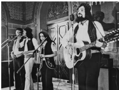
Група Камен на камен на 1. Бранковом колу 1972.