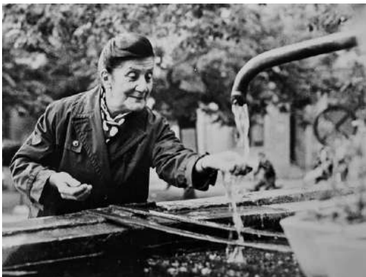
Десанка Максимовић на чесми Четири лава на 1. Бранковом колу 1972.