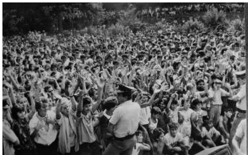
Публика на Бајајином концерту, Сјражилово 1986.