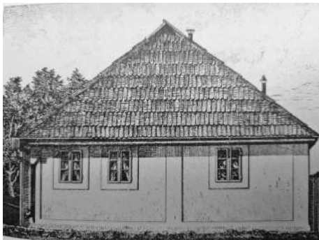
Кућа у Броду на Сави у којој се родио Алексије (Бранко) Радичевић